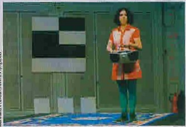
Bartrand Prieux/Centre Pompidou